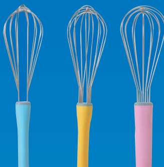
ブルー イエロー ピンク